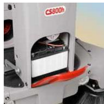
I motorversionerne er (CS700- 800 H), startbatteriet placeret foran på maskinerne, og er let tilgængelig for kontrol.