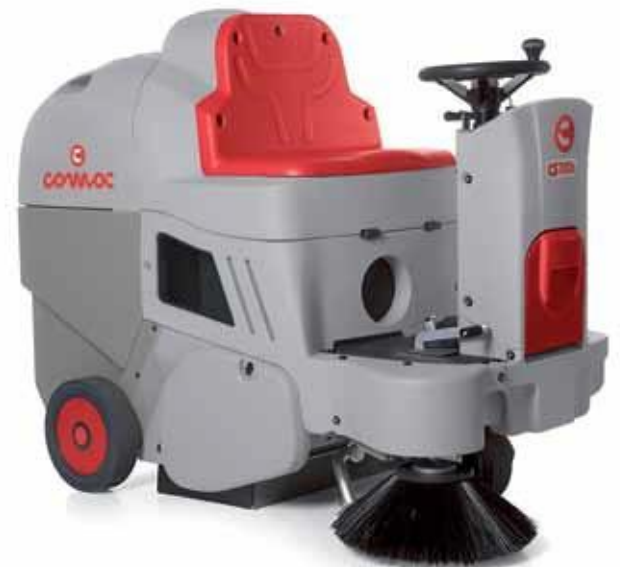
CS700 B manuel tømning