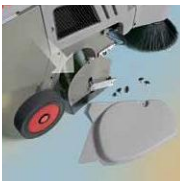
Center- og sidebørster kan udskiftes uden brug af værktøj.

Det enkle og strømlinede design gør vedligeholdelse af maskinen nemt.