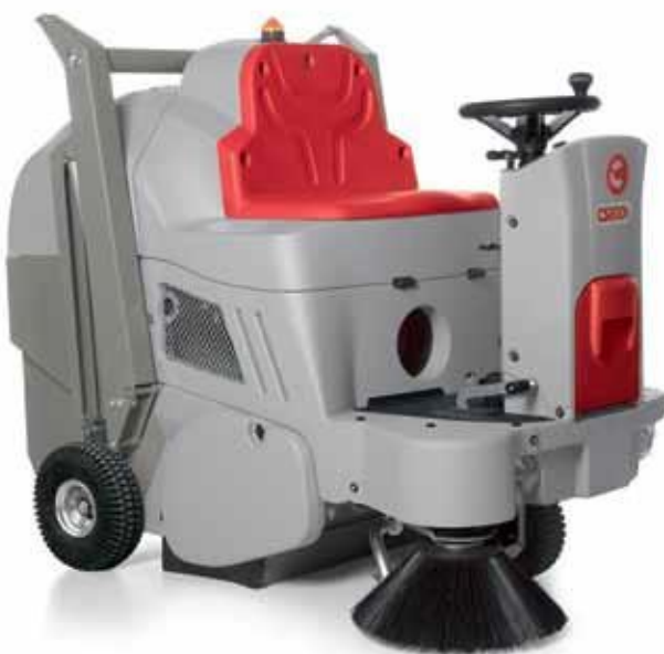
CS800 H Med automatisk tømning

Suge- og filterluft ledes ud gennem bagerste rist, der er placeret højt oppe på maskinen. Dette sikrer, at støv på gulvet ikke hvirvles op i maskinen, hvilket garanterer fantastiske rengøringsresultater.